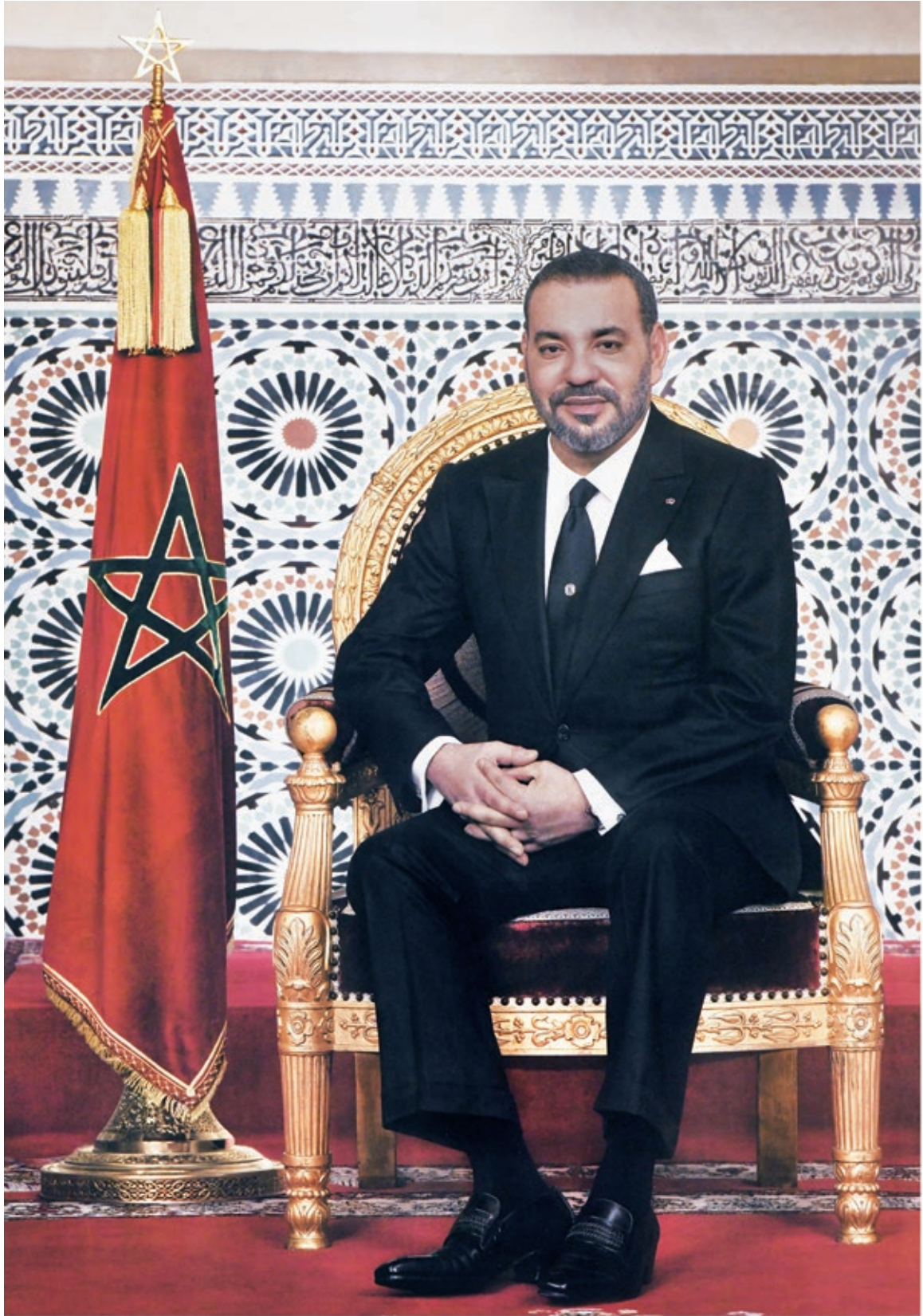
SA MAJESTÉ LE ROI MOHAMMED VI